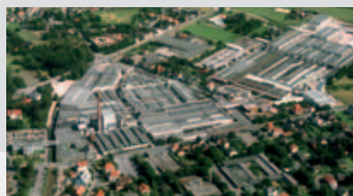
Deurenfabriek in Rheda-Wiedenbrück

Uw behoefte staat voorop. Samen met de betrokken partijen proberen we tot de best mogelijke oplossing te komen. Onze kracht is het inleven in de wens van de opdrachtgever en hierop ons advies te baseren. Daarnaast kenmerkt ons team zich door het persoonlijke contact, één aanspreekpunt gedurende het bouwtraject: inventief, flexibel en accuraat.