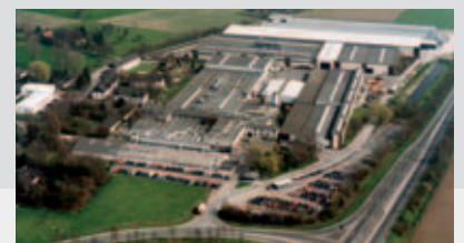
HPL fabriek in Wadersloh