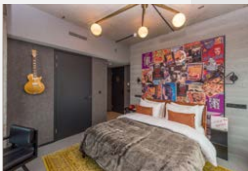
A'DAM Toren in Amsterdam

Deurblad-waarde 42dB; praktijk-waarde R_{w,p}=37dB(A)