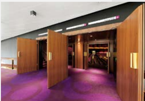
De Doelen Rotterdam

Deurblad-waarde 50dB; praktijk-waarde R_{w,p}=47\text{dB(A)}