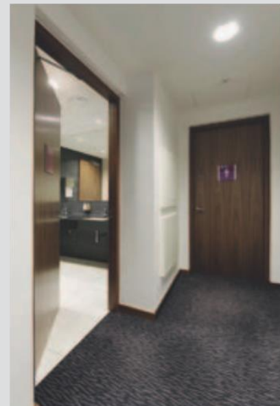
Crowne Plaza Amsterdam-Zuid