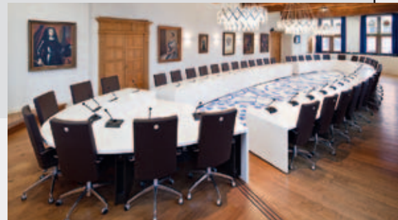
Raadzaal te Delft