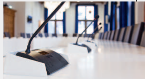
Raadzaal te Delft