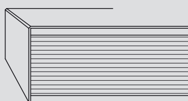
stomp, getaform/afgefindeerde kanten